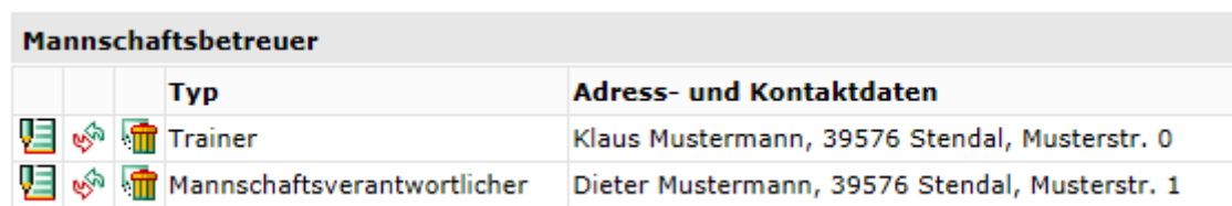
Abbildung: DFBnet-Portal Vereinsmeldebogen – Mannschaftsmeldung

Mit der Mannschaftsmeldung für eine neue Spielsaison können je Mannschaft diverse Mannschaftsbetreuer hinterlegt werden. Seitens des KfV wird empfohlen hier mindestens von einer Person die Kontaktdaten zu hinterlegen. Somit hat jeder Verein die Möglichkeit, sich die Kontaktdaten von anderen Mannschaftsbetreuer anzusehen. Diese werden ebenfalls auf der KfV-Homepage abgebildet.